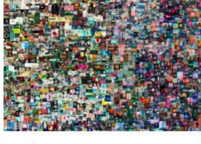
NOTÍCIAS - 21/09/2022 NFTS E BLOCKCHAIN NO MERCADO DE ARTE SÃO TEMA DA TERCEIRA EDIÇÃO DO "ENCONTROS ABACT"