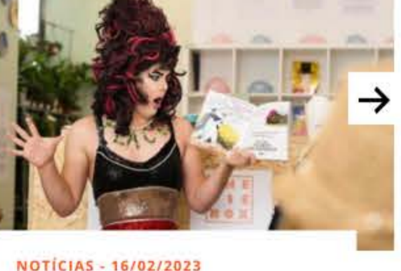
NOTÍCIAS - 16/02/2023 CONTAÇÃO DE HISTÓRIAS PARA CRIANÇAS FEITA POR DRAG QUEEN GERA PROTESTOS NA TATE BRITAIN