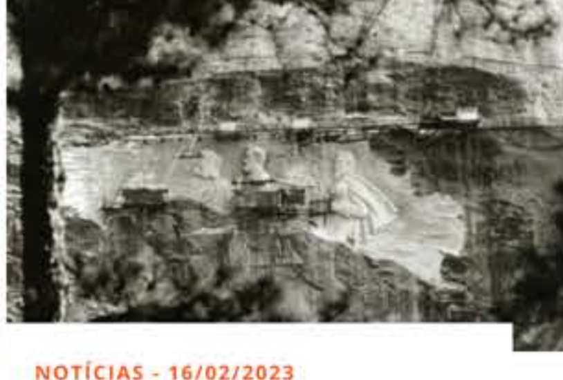
NOTÍCIAS - 16/02/2023 DOCUMENTÁRIO APRESENTA A HISTÓRIA RACISTA DO MAIOR MONUMENTO CONFEDERADO DA AMÉRICA