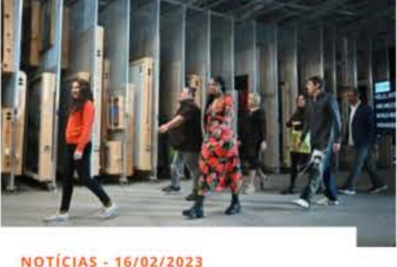
NOTÍCIAS - 16/02/2023 REALITY SHOW VAI DEFINIR QUEM VAI EXPOR EM MUSEU