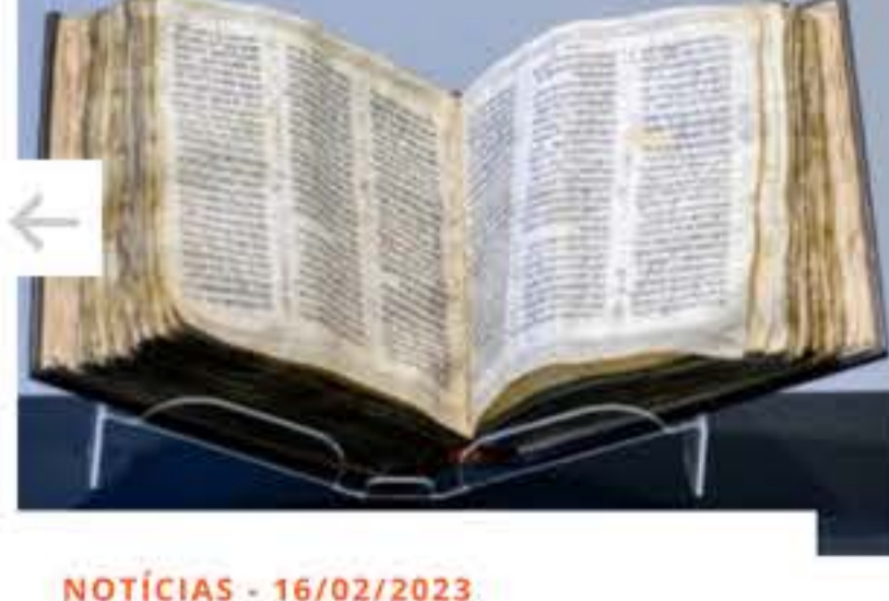
NOTÍCIAS - 16/02/2023 BÍBLIA HEBRAICA MAIS ANTIGA VAI A LEILÃO COM ESTIMATIVA DE US$50 MILHÕES