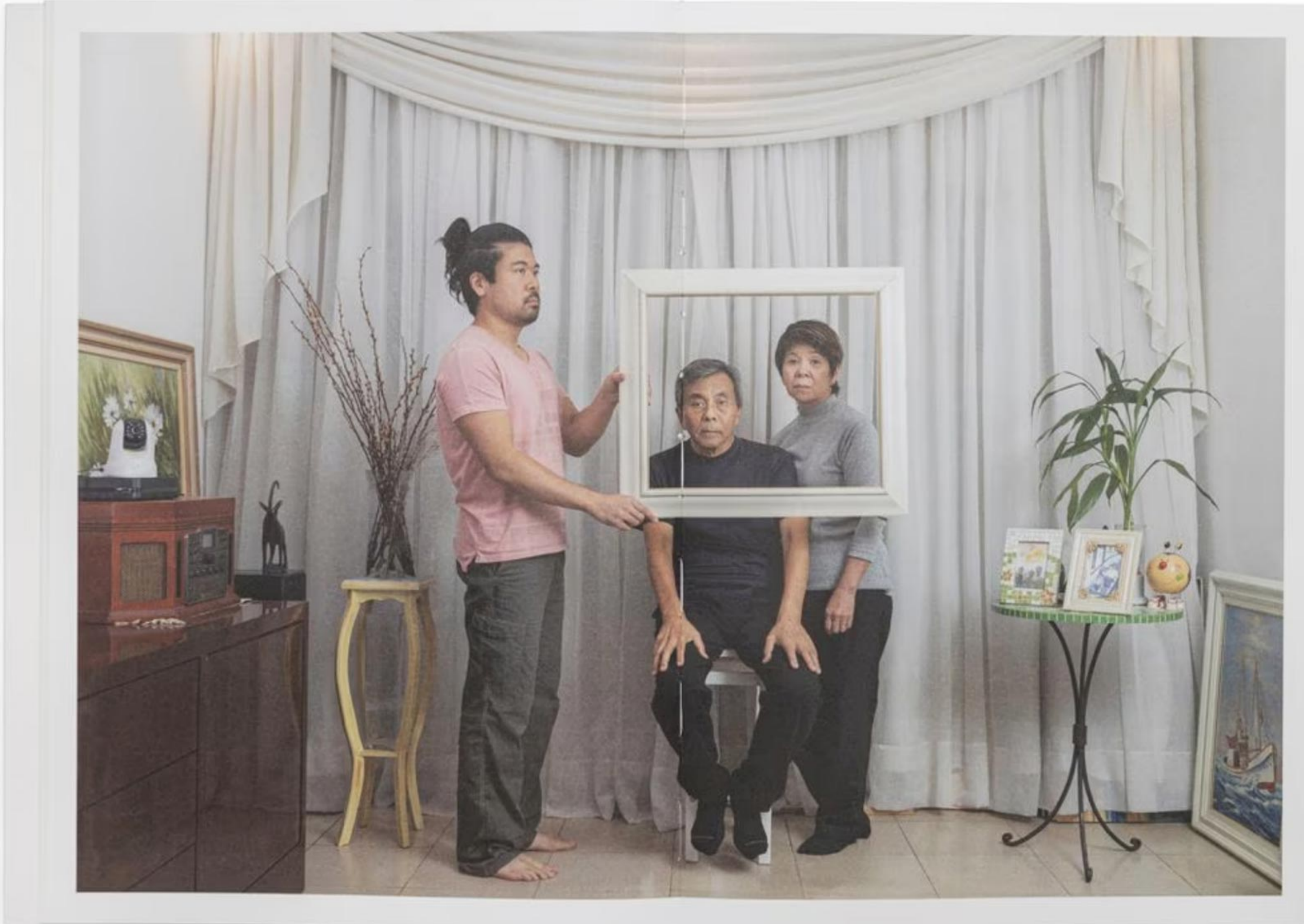
Una imagen de 'Utaki', de Ricardo Tokugawa (editorial Lovely House). RICARDO TOKUGAWA

Profesionales y expertos de la fotografía seleccionan sus títulos favoritos del año que termina