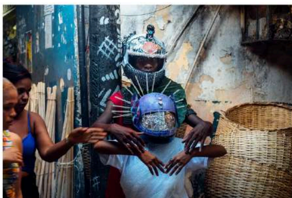
Uma das fotografias que estarão expostas durante a mostra em Porto Alegre

A Mostra de Arte Aberta Porto Alegre (MAAPA) quer mudar visualmente o cenário urbano da Capital a partir desta sexta-feira (19). Obras fotográficas estarão expostas em painéis de diferentes pontos da cidade, transformando o cenário urbano em uma espécie de galeria a céu aberto ( confira os locais abaixo ). A exposição vai se estender por um mês.