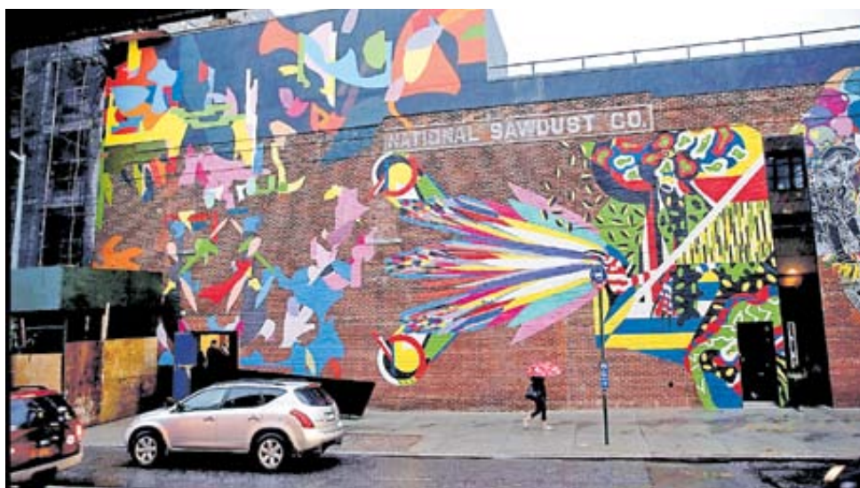
Mural hecho por el artista en el 2016 en el National Sawdust, sala de conciertos en Nueva York.

La instalación se completa con las líneas en zigzag que cubren todo el suelo, obvia referencia a la serie "Twin Peaks", de la que avaf es confeso admirador. Así, con esa multiplicidad de referencias inspiraciones, la obra de avaf es una que no solo invita a mirar, sino a estar e interactuar. Hay que sumergirse en ella.